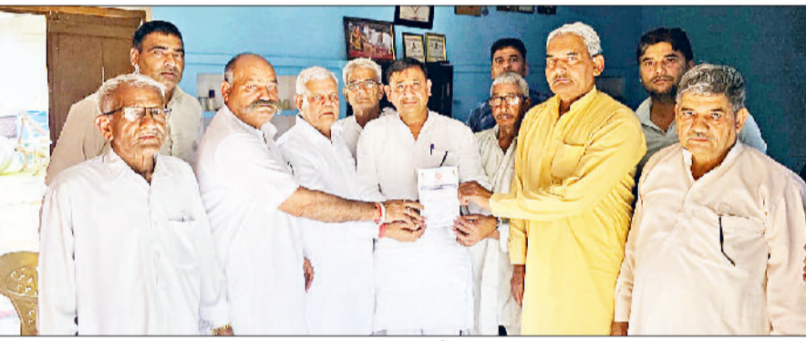
इज्जर। कार्यक्रम का निमंत्रण देते हुए ब्राह्मण महासभा के पदाधिकारी।