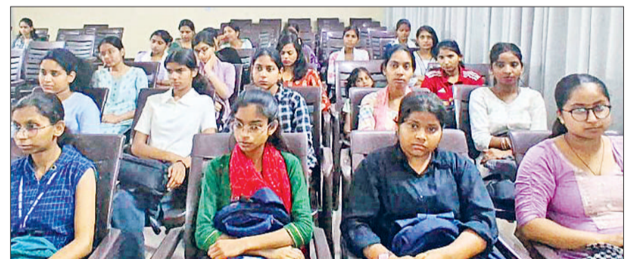
बहादुरगढ़। वैश्य आर्य कन्या महाविद्यालय में आयोजित सेमिनार में मौजूद छात्राएं।