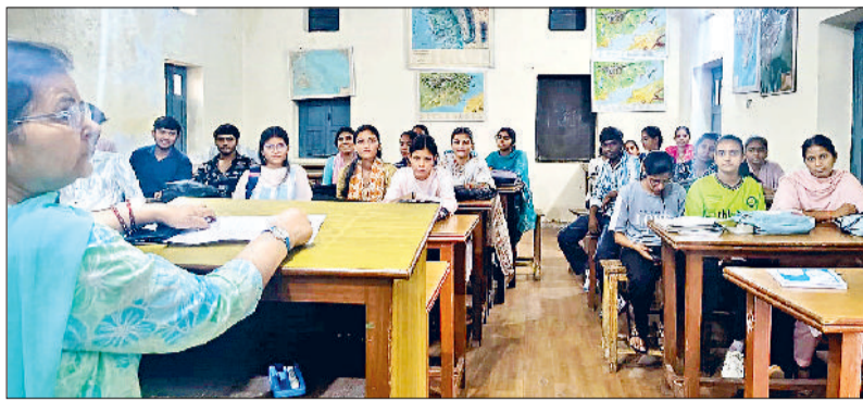
झज्जर। कार्यक्रम के दौरान उपस्थित विद्यार्थियों को संबोधित करते हुए विषय विशेषज्ञ।