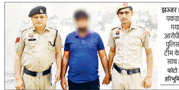
झज्जर। पकड़ा गया आरोपी पुलिस टीम के साथ।