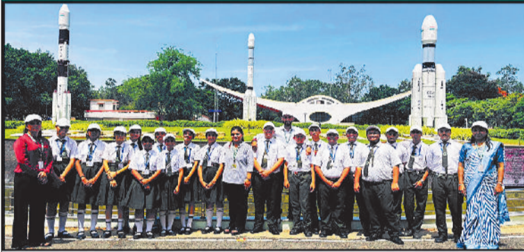
Learning beyond classrooms through educational visit to ISRO.