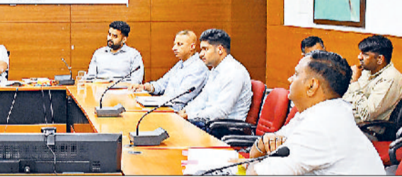
इज्जर। बैठक के दौरान मौजूद अधिकारी।

इज्जर। सोमवार को लघु सचिवालय समागार में आयोजित बैठक में डीसी स्वप्निल रविंद्र पाटिल ने बाद राहत उपायों की तैयारियों की समीक्षा की। उन्होंने संबंधित विभागों को निर्देश देते हुए कहा कि सभी विभाग आपसी सहयोग बनाकर कार्य करें ताकि बेहतर परिणाम सुनिश्चित किए जा सकें। उन्होंने कहा कि मानसून सीजन से पहले नगर निकाय, सिंचाई, जन स्वास्थ्य, लोक निर्माण, एचएसवीपी, एचएसआईआईडीसी व मार्केटिंग बोर्ड सहित सभी विभाग अपने-अपने क्षेत्राधिकार में आने वाले जल निकासी नालों एवं ड्रेनों की सफाई समय पर पूर्ण करें। साथ ही बाद राहत से जुड़े प्रोजेक्ट्स को भी निर्धारित समय से पहले पूरा करने पर विशेष ध्यान दिया जाए। बैठक में सिंचाई विभाग के अधीक्षण अभियंता उत्तीश जना ने बताया कि जिले में कुल 58 ड्रेन हैं, जिनमें 7 बड़ी ड्रेन हैं। सभी ड्रेनों की सफाई का कार्य मानसून से पूर्व पूरा कर लिया जाएगा।