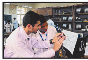
Learning becomes easy through experiments in the science lab.