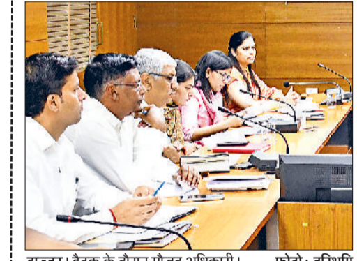
इज्जर। बैठक के दौरान मौजूद अधिकारी।