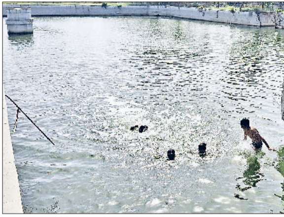
इज्जर। ऐतिहासिक बुआ हसन तालाब में नहाने हुए नाबालिग।

नाबालिगों के हासिले इतने बुलंद हैं कि तालाब के बीचों बीच बने गुंबद पर भी चढ़ छलांग लगाते हैं