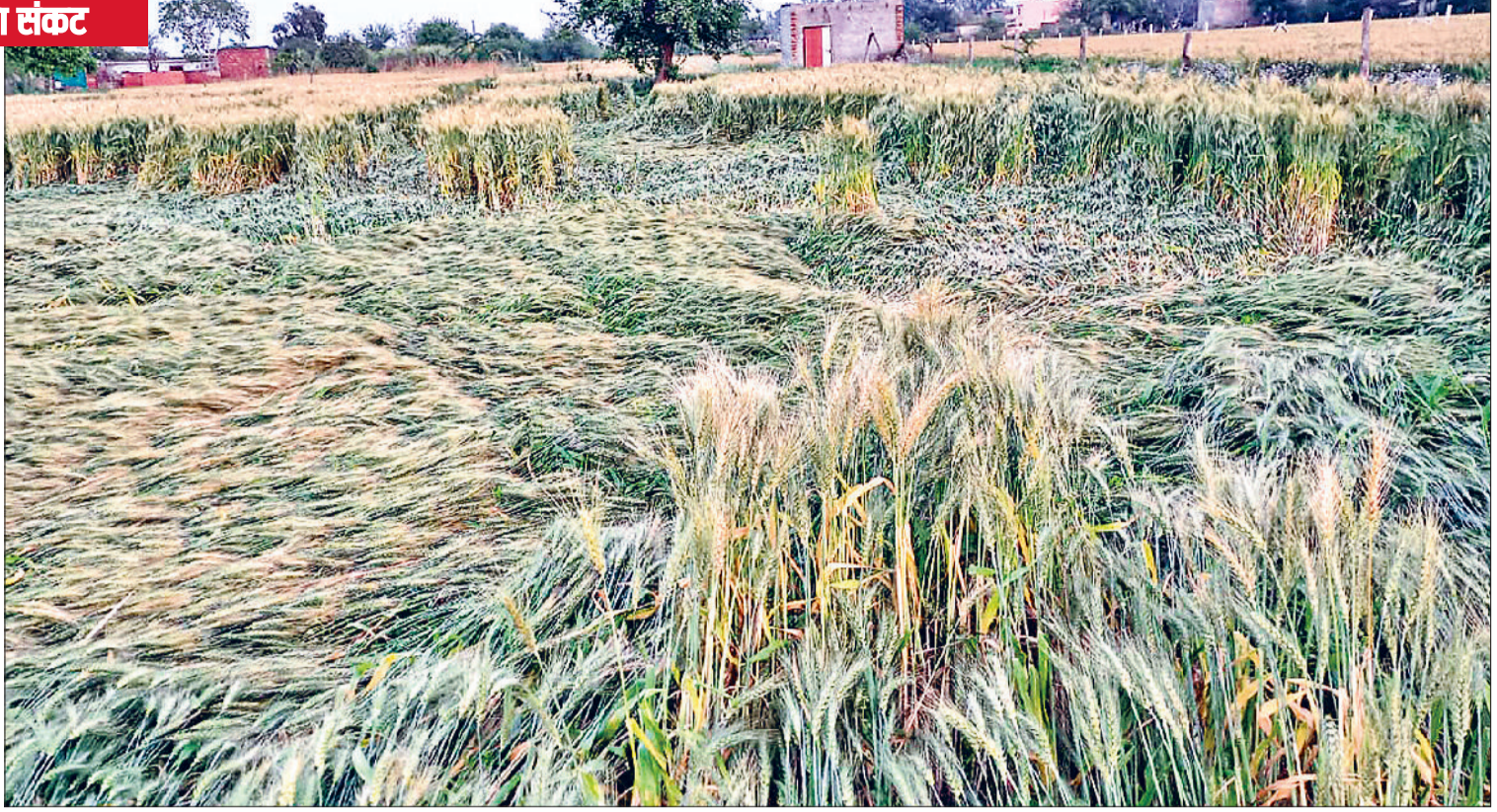
झज्जर। बरसात और तेज हवा के कारण बिछी गेहूं की फसल, जिससे किसानों को उत्पादन में कमी की आशंका बढ़ गई है।

पैदावार कम होगी। उन्होंने कहा कि इससे पहले हुई बारिश से भी काफी नुकसान हुआ है। अगर फिर बारिश होती है तो पूरी मेहनत पर ही पानी फिर जाएगा।