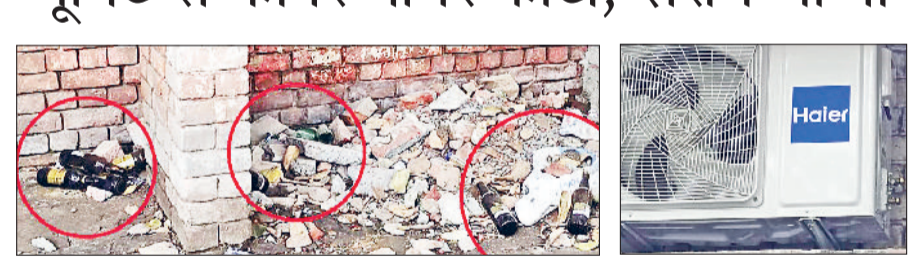
बहादुरगढ़। मौके पर मौजूद बीयर की बोतलें और इस आउटडोर यूनिट की काटी गई वायर।

की वारदात हो चुकी है। कभी चिकित्सा संबंधित उपकरण व कंप्यूटर चोरी हुए तो कभी एयर कंडीशनर की आउटडोर यूनिट पर हाथ साफ कर दिया गया। हालांकि अस्पताल में सुरक्षा गार्ड की व्यवस्था है लेकिन इसके बावजूद चोर वारदात को अंजाम दे जाते हैं।