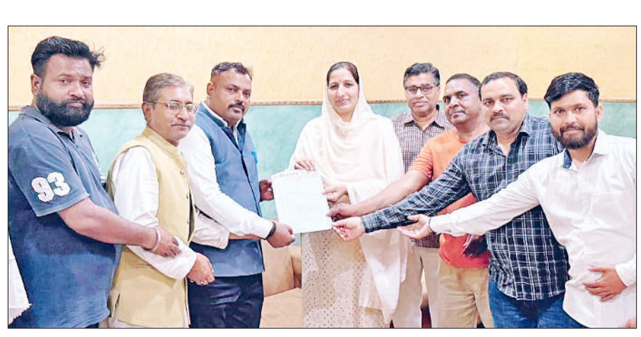
बहादुरगढ़। चेरपरसंस को ज्ञापन सौंपते समिति के पदाधिकारी।