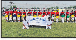
Promoting fitness, teamwork and excellence through sports activities.