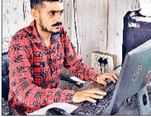
सरसों खरीद के लिए टोकन काटते हुए।

डीसी ने बताया कि जिले में गेहूं की खरीद के लिए झज्जर, बेरी, छारा, मानगढेल, माजरा दूबालथन, बहादुरगढ़, पाटोदा, आशोदा, बादली तथा दाकला सहित कुल 10 मंडियां निर्धारित की गई हैं, जबकि सरसों की खरीद के लिए झज्जर, बेरी, मानगढेल, दाकला एवं बहादुरगढ़ मंडियों में व्यवस्था की गई है।