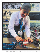
Building future-ready skills through robotics and innovation.