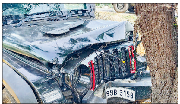
झज्जर। पेड़ से टकराकर क्षतिग्रस्त हुई थार गाड़ी।