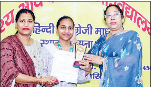
बहादुरगढ़। मेधावी छात्रा को सम्मानित करती शिक्षिका।